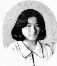
小沼 房 子 水戸工場 設管 TEL 585 〒#16